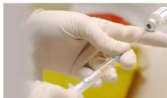
Una enfermera prepara una vacuna MADRID, 28 Nov. (EUROPA PRESS) -

La Sociedad Española de Epidemiología ha recomendado reforzar la campaña de vacunación frente a la gripe para aumentar las coberturas entre profesionales sanitarios y personas con enfermedades crónicas, y lamenta que las actuales coberturas de vacunación en profesionales sanitarios y en pacientes con enfermedades crónicas sean "tan bajas".