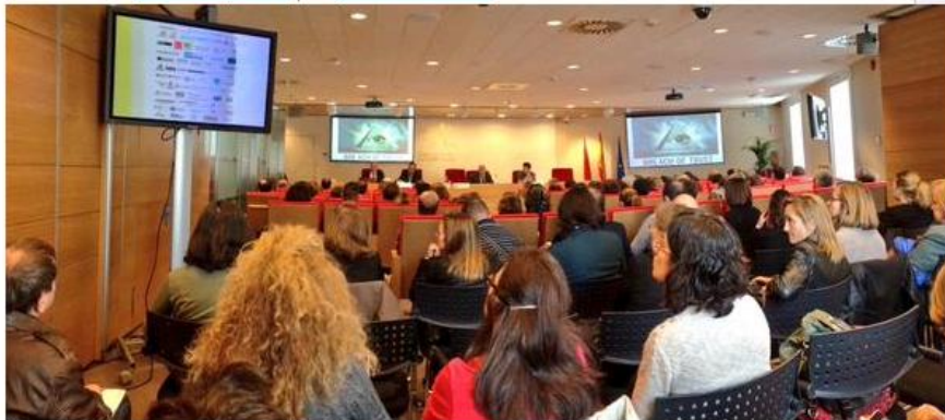
Imagen del salón de actos del Consejo General de Colegios Oficiales de Médicos (CGCOM)

Publicado el 16 marzo, 2015 por Melania Bentué