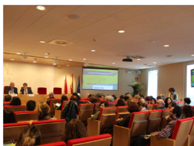
Jornada protección de datos SEE-OMC